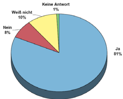
Bild 1: Frage: Würden Ihnen bessere Kurzbeschreibungen (Zusammenfassungen) von Normen helfen, Fehlkäufe zu vermeiden?