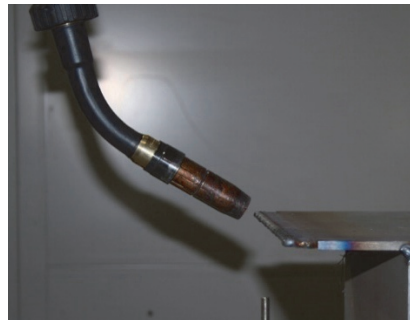
Abbildung 2: Horizontaler Überhang mit schräggeltem Schweißbrenner /1/

2012 haben Kazanas et. al. eine Methode aufgezeigt, mit der Überhänge bis zu 0^\circ fertigbar sind. Um das zu erreichen, wurde der Winkel des Schweißbrenners auf den Winkel der Wand eingestellt. Dadurch konnten im Gegensatz zu /5/ noch deutlich kleinere Winkel gefertigt werden. In Abbildung 2 wird dargestellt, dass sogar horizontale Überhänge möglich sind, wenn der Schweißbrenner passend eingestellt wird. /1/